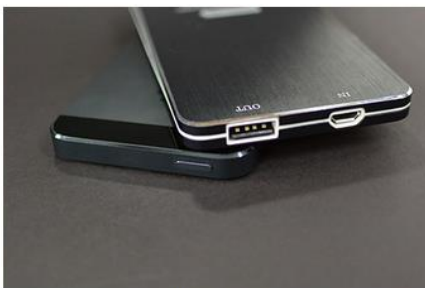
超薄型スリムボディ