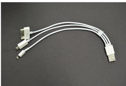
USB対応の三又コネクタ付属 ※仕様変更となる場合がございます