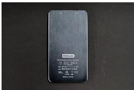
裏面には性能等を表示