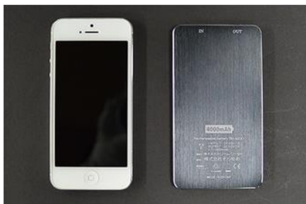
スマートフォンとほぼ同サイズ