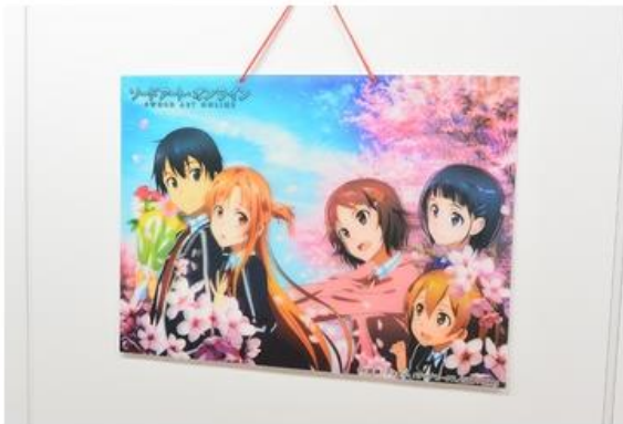
製品に傷を付けずに飾れます