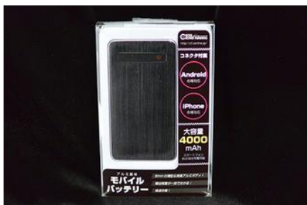
ブリストルパッケージに入れて発送いたします