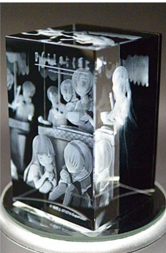
手前・中央・奥側とピントを分けて撮影しています。