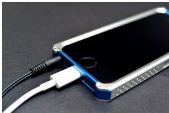
フレームを装着したまま、各種コード類の接続、ボタン操作が可能です