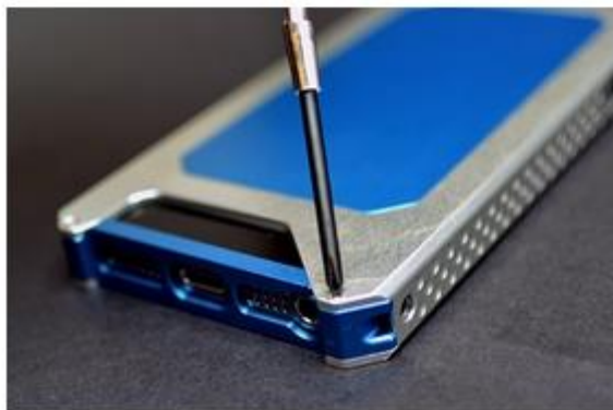
付属の精密ネジによって装着するため、カタつくことはありません