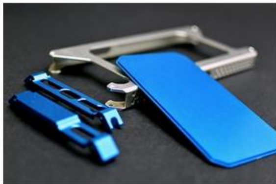
各パーツは付け替えが可能