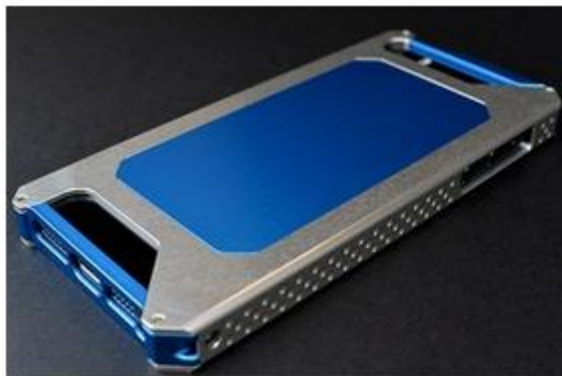
高級感あふれるアルミ削り出しボディ